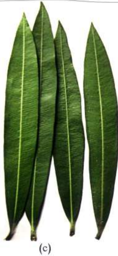
الشكل رقم (2): أوراق نبات الدفلة Nerium oleander -a أوراق من المنطقة الأولى، -b أوراق من المنطقة الثانية، -c أوراق من المنطقة الثالثة.