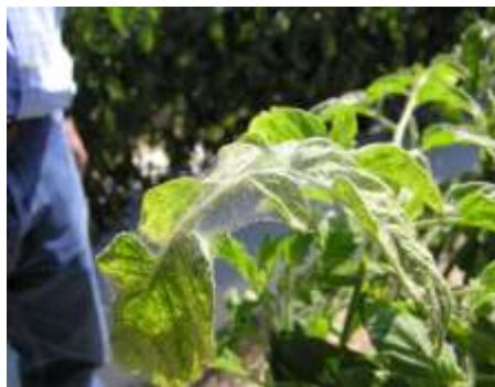
الشكل (2): أعراض الإصابة

يعود العنكبوت الأحمر ذو البقعتين Tetranychus urticae Koch لعائلة Tetranychidae ضمن رتبة Acari وهو من الآفات الاقتصادية الخطيرة التي تصيب العديد من العوائل النباتية المختلفة، كالعائلة الباذنجانية البقولية، الخبازية، النجيلية، نباتات الزينة، أشجار الفاكهة، والأدغال ويسبب لها خسائر اقتصادية كبيرة إذ تقوم الافراد المتحركة للآفة بامتصاص العصارة النباتية من الاوراق، والبراعم وإحداث تشوهات فيها، فضلاً عن تجمع الاتربة والغبار على الشبكة التي تنسجها، مما يؤدي إلى عرقلة عملية التركيب الضوئي وقلة تكوين الاوراق الجديدة، والازهار، وجفاف الاجزاء المصابة وموتها. استخدمت عدة اساليب لمكافحة هذه الآفة، وكان على رأسها المبيدات الكيميائية إلا أن الاستخدام الخاطئ والمفرط لها نجم عنه العديد من التأثيرات السلبية الضارة في النظام البيئي، كاختفاء بعض الاعداء الطبيعية كالمفترسات والطفيليات وظهور سلالات مقاومة لفعال المبيد فضلاً عن تلوث البيئة.