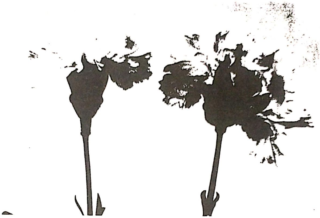
الصورة (1): ظاهرة الكأس في الصنف White sim.

خمسة أسابيع. درس Beisland and Kristoffersen عام (1969) تأثير درجات الحرارة على عدد البتلات في الصنف William sim وعلى الرغم من ملاحظتهما بعض الاختلافات إلا أن الفروق لم تكن معنوية بالمقارنة بين أزهار نباتات تطورت في المدى الحراري بين (12-24°م).