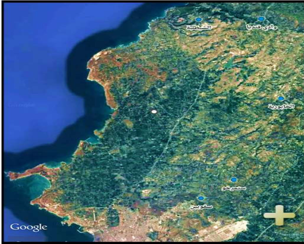
الشكل(1) توزع المقاطع المدروسة على الصورة الفضائية لمحافظة اللاذقية.المأخوذة من Google عام 2018.

جرى اختيار خمسة مواقع لمقاطع ترب موزعة على مواد أصل كلسية في مناطق مختلفة من محافظة اللاذقية وهي : سقوبين (SK)، ستمرخو (ST) ، الخابورية (KH) ، وادي قنديل (WK) والشبيلية (CH) ، الشكل (1) .