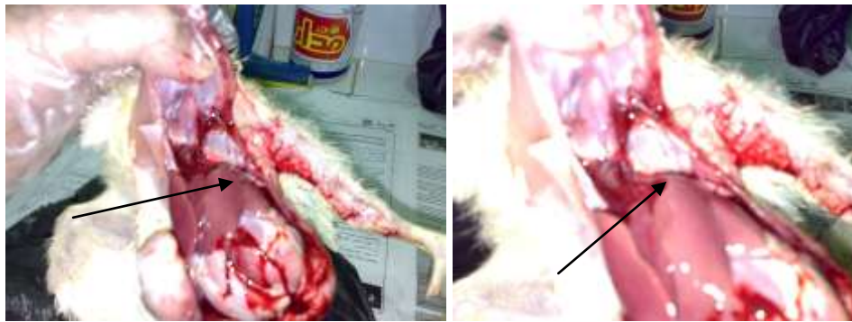
الصور رقم ( 5,6 ) توضع الآفات الفطرية في الرئتين