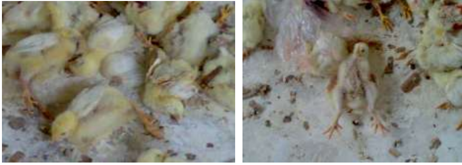
الصور رقم ( 1,2,3,4 ) الأعراض السريرية العصبية