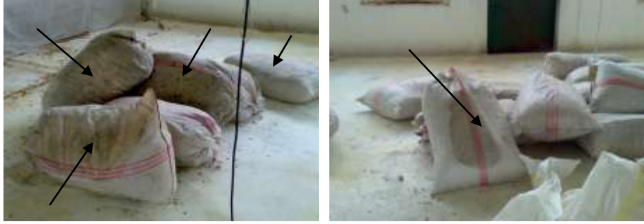
الصور رقم ( 9,8 ) أكياس النشارة المخزنة والمسترطبة