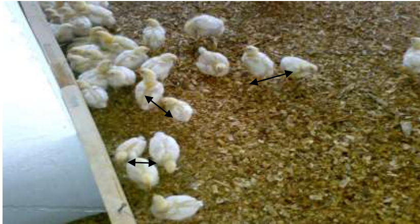
الصورة رقم ( 10 ) التفاوت الواضح في نمو الصيصان نتيجة الإصابة الفطرية