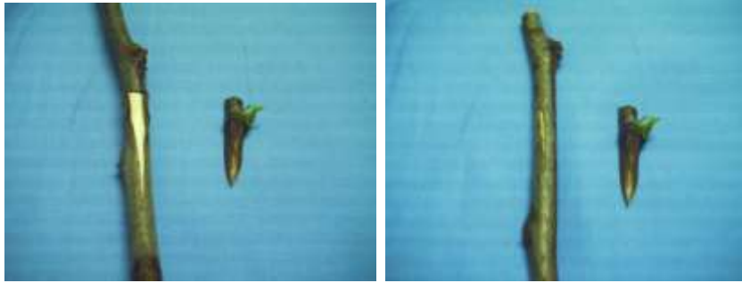
الشكل (7) تحضير الطعم والأصل