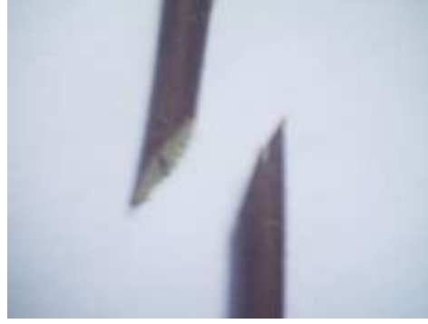
الشكل(5) تحضير الطعم والأصل