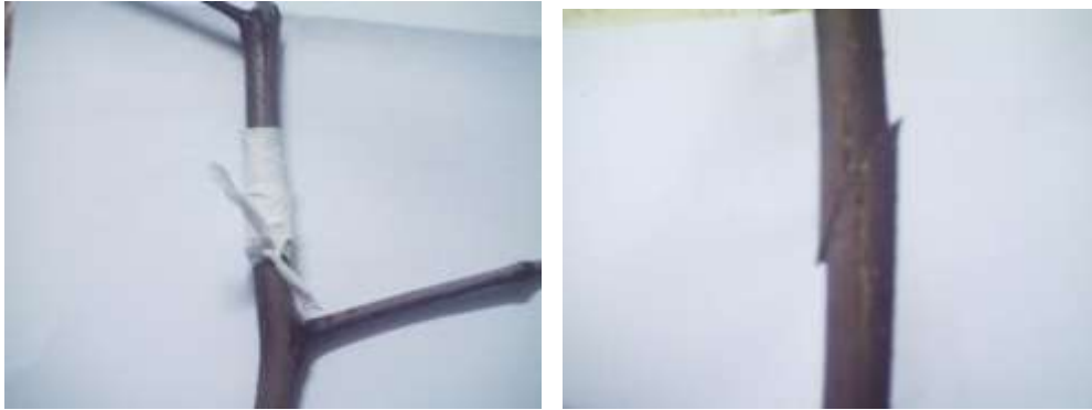
الشكل(6) تثبيت الطعم على الأصل بطريقة التطعيم اللساني