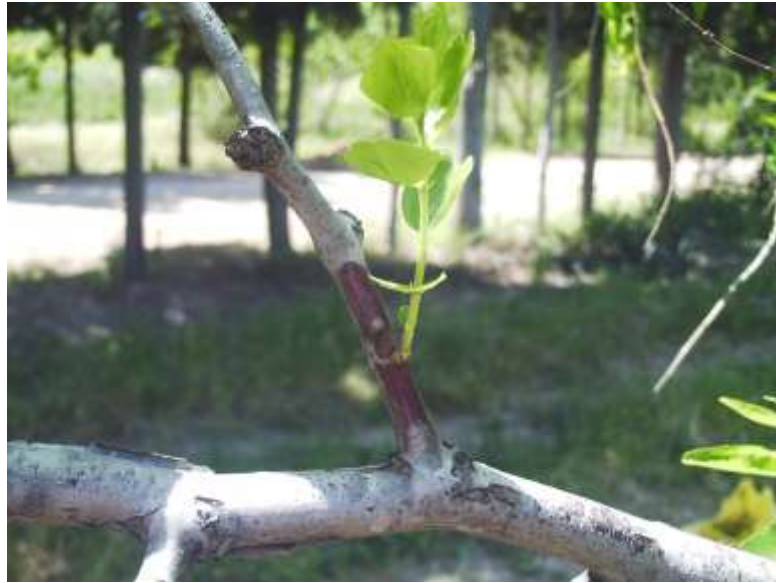
الشكل (10) نجاح عملية التطعيم بالطريقة الروسية

و في حال استخدام البرعمة الروسية ( B ) تشير النتائج الموضحة في الجدول (2) أن نسب نجاح المطاعيم عالية بشكل عام و مختلفة باختلاف الأصناف ( الكمثري - المدعبل - الحفاوي ) والشكل رقم (10) يوضح نجاح عملية التطعيم .