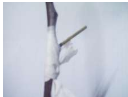
الشكل (4) تثبيت الطعم على الأصل بطريقة البرعمة الروسية (B)Breclad