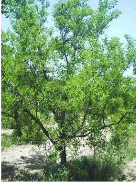
الشكل (1) الشكل العام لشجرة العناب