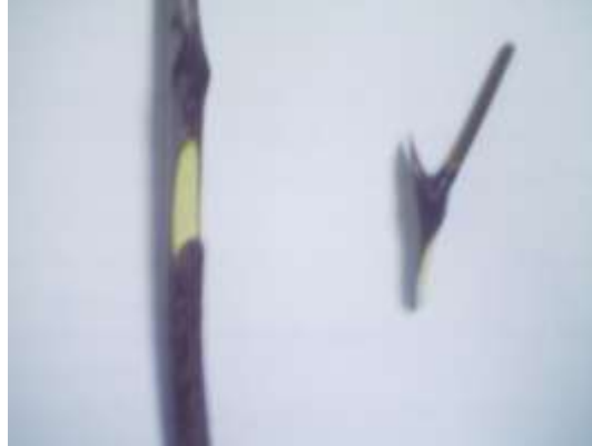
الشكل (3) تحضير الطعم والأصل

في كل موعد تم التطعيم بالأصناف المدروسة لكل صنف ثلاثة مكررات في كل مكرر (10 غراس) .