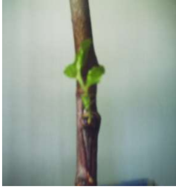
الشكل (9) نجاح عملية التطعيم بطريقة البرعمة الدرعية

و في حال استخدام البرعمة الروسية ( B ) تشير النتائج الموضحة في الجدول (2) أن نسب نجاح المطاعيم عالية بشكل عام و مختلفة باختلاف الأصناف ( الكمثري - المدعبل - الحفاوي ) والشكل رقم (10) يوضح نجاح عملية التطعيم .