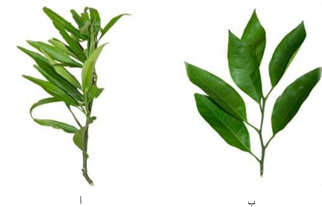
شكل(2): زيادة التفرعات الجانبية في أشجار "الساتزوما" المصابة ب CTV (أ) مقارنة مع السليمة(ب)

الإصابة بالأمراض الفيروسية تنبه البراعم الساكنة والجانبية فيميل النبات لإعطاء تفرعات جانبية عديدة على حساب النمو الطولي (القمي).