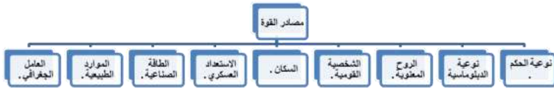
شكل رقم (2): عناصر القوة الشاملة للدولة حسب بعض مفكري العلاقات الدولية

القوة هي القدرة في التأثير على الآخرين، وإن المجتمع أو الدولة القوية هما القادران على التأثير في الآخرين ويعمل الآخرون من الدول والمجتمعات لها حساباً. فلا بد أن تكون لهذه الدولة مقومات تضطر المجتمعات والدول الأخرى للخضوع لها فما هي مصادر القوة عند هذه الدولة القوية أو ذلك المجتمع المؤثر؟ أولاً: مصادر القوة: