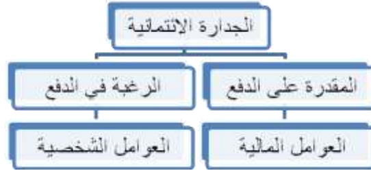
الشكل رقم (1) عوامل (متغيرات) الجدارة الائتمانية

الدفع يمكن تقييمها من خلال العوامل المالية، أما الرغبة في الدفع فيمكن تقييمها من خلال العوامل الشخصية التي تعبر عن مدى توفر ثقافة الالتزام لدى العميل، ويمكن التعبير عن ذلك من خلال الشكل التالي رقم (1).