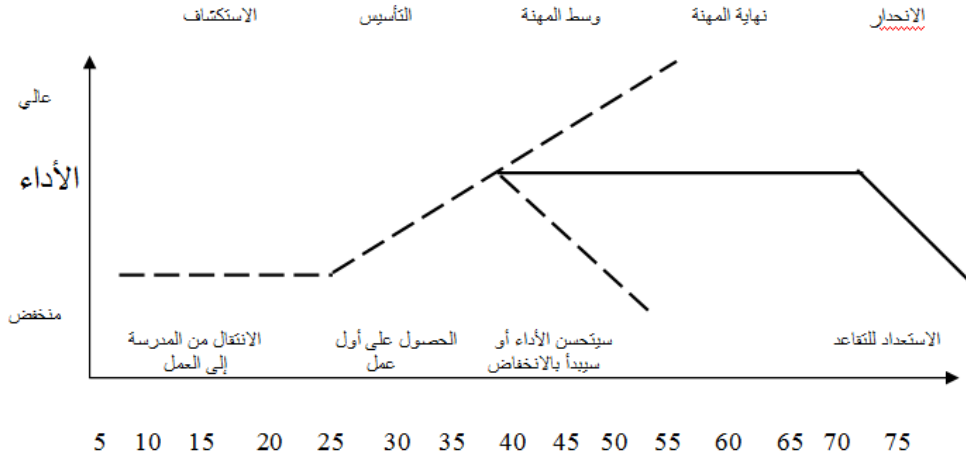
الشكل (1): مراحل المسار الوظيفي للعاملين. (Haider, 2007, p 183)

موظف ما بعمر (45) بتغيير عمله نتيجة اكتشاف قيم ومهارات جديدة، في هذه الحالة سيكون له نفس مخاوف الشخص بعمر (25) في مرحلة التأسيس ولكن مع (20) سنة من الخبرة.