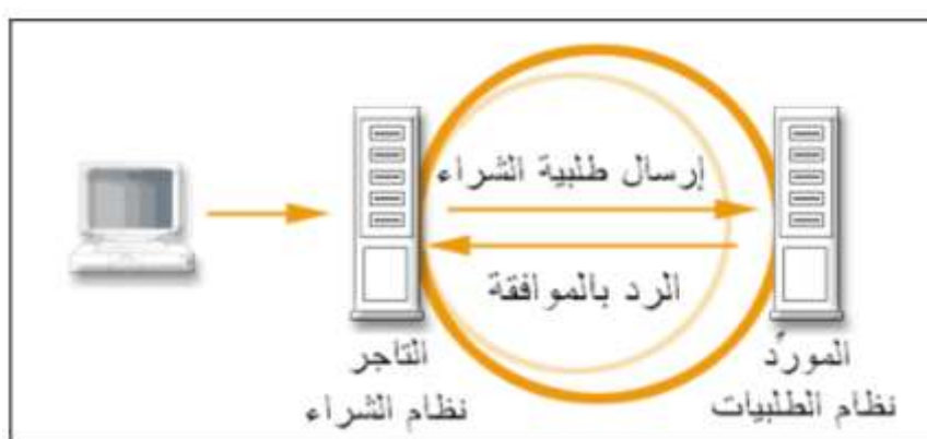
شكل رقم (1) : نظام تبادل البيانات إلكترونياً

تحول برمجيات التبادل الإلكتروني في الطرف المرسل الوثيقة إلى صيغة معيارية، ثم يتم الاتصال بطلب رقم الهاتف لشبكة القيمة المضافة وتنقل الرسالة الموجودة في ملف داخل الكمبيوتر المرسل إلى صندوق بريد إلكتروني على شبكة القيمة المضافة، وتتمكن بذلك برمجيات الشركاء التجاريين من استخراج الملف من صندوق البريد الإلكتروني، وتفسير الرسالة التي يحويها، وفحص مدى توافقها مع معايير التبادل الإلكتروني لديها، ثم تخزينها. ويتم بعد ذلك إرسال رسالة تعارف وظيفي وإبلاغ المرسل إن تم استقبال الرسالة أم لا، وإبلاغه -في حال وجود أي مشكلة في الاتصال- إن كانت الرسالة متوافقة مع معايير تبادل البيانات إلكترونياً أم لا.