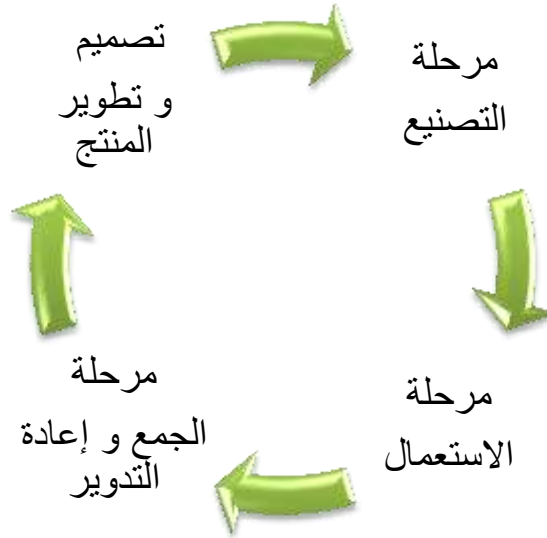
الشكل (3): دورة الاستعمال في دورة حياة المنتج الأخضر