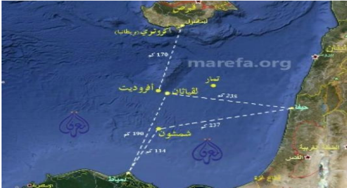
الشكل رقم (4)