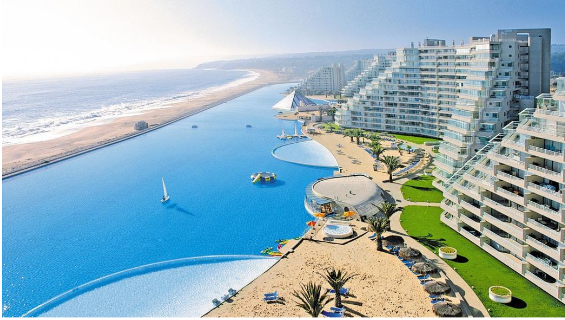
الشكل 2: منتجع سان الفونسو ديل مار في تشيلي

وكذلك وجدت هذه البحيرات الصناعية في المشاريع السكنية الضخمة كما في منطقة تلال الامارات الفخمة حيث تنتشر عشرات البحيرات الصناعية الصغيرة التي تطل عليها الفلل والمنازل الريفية التصميم وتحضنها الأشجار والحشائش وكذلك نجد هذا الاستخدام في منطقة مرسي دبي المحاذية للخليج العربي فقد حرص مطوروها على شق قنوات مائية وبحيرات متعددة لتمتلك ناطحات السحاب اطلالات على الماء من كافة جوانبها .