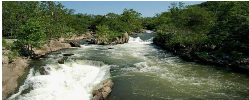
الشكل 5: تداخل التيارات المائية مع البيئة المحيطة من صخور وعناصر خضراء

الماء الجاري : وتعد الأنهار والجداول والتيارات المائية امثلة لهوتكون حركة المياه فيه اما هادئة اذا كانت الميول خفيفة او حركة المياه مضطربة اذا كانت الميول شديدة واذا كان يوجد عائق في طريقها ويكون في تداخله مع الطبيعة المحيطة من صخور واشجار بيئة فريدة من نوعها حيث تقام المطاعم والمباني السياحية على ضفافها للتمتع بهذا الجمال الطبيعي الشكل 5 .