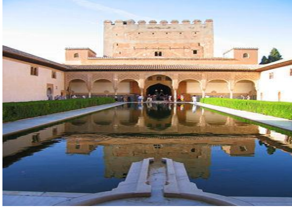
الشكل 10: انعكاس المباني التاريخية على سطح الماء - قصر الحمراء

• الشفافية او الانعكاس : كثيرا مايلحظ الانسان انعكاس صورته على سطح الماء وفي البيئة العامة يعكس الماء ملامح وشخصية الفراغ المحيط به حيث يمثل السطح المائي مرآة تعكس كل مايحيط بها من منشآت ونباتات وعناصر العمران والعناصر البشرية حيث يعطي قيمة جمالية من خلال تأكيد بعض المباني الرئيسية او التراثية وضخامتها بانعكاس واجهتها على سطح الماء الشكل 10 .