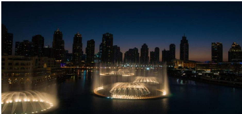
الشكل 9: نافورة دبي في الامارات

كما تكون للنوافير وظائف ترفيهية كما في نافورة دبي الراقصة التي تقع على بحيرة برج خليفة في قلب المدينة حيث تقدم مجموعة من العروض الموسيقية والضوئية الساحرة في تتاعم يخطف الابصار ويخلب الالباب حيث الانوار المشعة تتوهج كالجوهرة مع انغام الموسيقى الكلاسيكية والعصرية من شتى بقاع الأرض الشكل 9 .