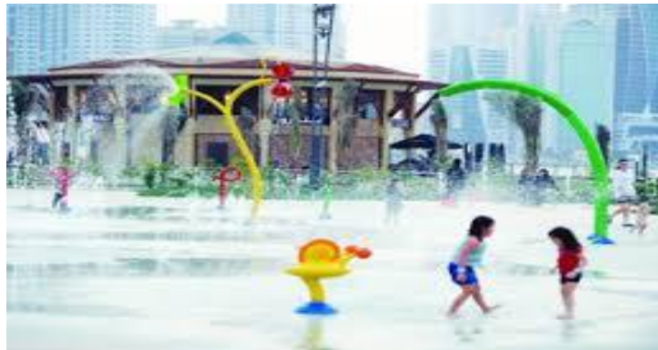
الشكل 13 حديقة الألعاب المائية بالشارقة