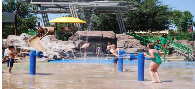
الشكل 12: الحلقات المعدنية في منتزهات تمبي تمطر رذاذ خفيف من الماء للعب الاطفال

يستخدم الماء في النواحي الترفيهية وذلك لم له من خواص حركية وصوتية متنوعة تحمل معاني البهجة والمرح وقد نجد التشكيلات المائية في العاب الأطفال المائية والتي انتشرت في الساحات العامة والتي أصبحت مصدر جذب كبير والتي تعتمد على الابهار وحركات الماء المتنوعة كما في حديقة الألعاب في منتزهات تمبي الشكل 12 في مدينة فينيكس في ولاية اريزونا او في حديقة الألعاب المائية بالشارقة الشكل 13 حيث تقدم للأطفال واسرهم وجهة ترفيهية فريدة ومفهوما مبنكرا حيث توفر ساحة العاب مائية اتوماتيكية بالكامل بنظام المنصة بدون أي عمق للمياه لتلائم جميع الأطفال حيث لن يكون هناك مياه راكدة في المنطقة المائية مما يحد من المخاطر التي تهدد سلامة الأطفال الى حد بعيد ويجعل هذا النظام استثنائيا ومتميزا حيث تقدم مختلف اشكال المياه المتدفقة بشكل فني واللعب تحت ستار المياه في القبة المائية ومطاردة رفاقهم واستهداف الاخرين بمدافع ورشاشات المياه مع وجود النوافير المائية مما يجمع بين التعلم واللعب والمرح مع مراعاة معايير السلامة والأمان كما تعمل التقنية الحديثة المستخدمة على التقليل من استهلاك المياه من خلال التفعيل المتسلسل وتقنية الفوهة المنخفضة التدفق.