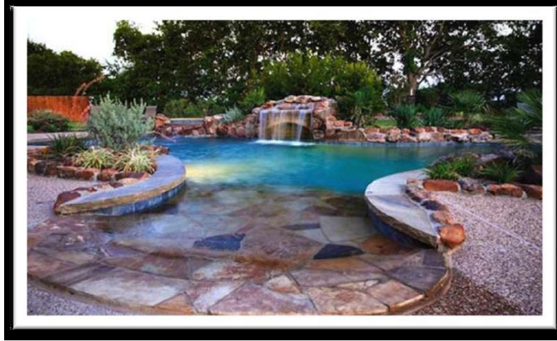
الشكل 4: حوض سباحة خاص وتداخله مع البيئة الطبيعية