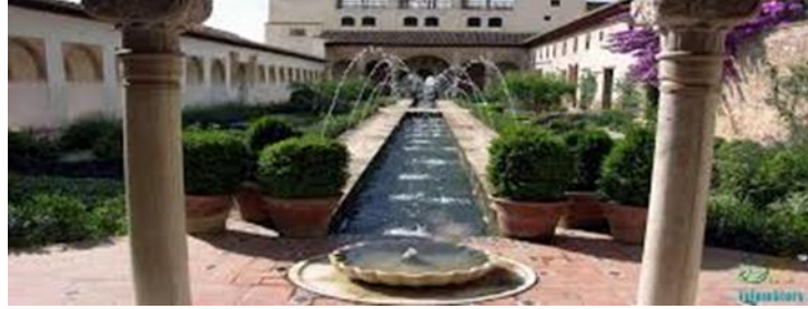
الشكل 7: نافورة في قصر الحمراء

تعد النوافير من الفنون المعمارية التي تبرز جمال الطبيعة وتبعث المبهج في النفوس وهو دفع الماء للأعلى بعكس اتجاه الجاذبية وتاريخيا وجد في المنازل التراثية ذات الفناء الداخلي حيث كانت النافورة في البيت العربي ذات شكل رمزي ثماني او سداسي ويكون في الداخل شبه دائرة ويرمز هذا الشكل لقبة السماء ، وكذلك في القصور كقصر الحمراء الشكل 7 حيث كانت المياه المتدفقة من النافورات في جنة العريف توجه بمهارة حول حافة حوض المياه حيث تتشكل تموجات نصف دائرية على سطح الماء المتدفق وكذلك في ساحة الأسود اذ يحمل صحن النافورة اثنا عشر اسدا يخرج الماء من افواهها وهي تمثل ساعة ميفاتييه حيث يخرج الماء كل ساعة من فم اسد وفي الساعة التالية من اسدينيوخرج من فم كل الأسود حين تكتمل الدورة وتمثل لغزا حير العلماء لعقود طويلة.