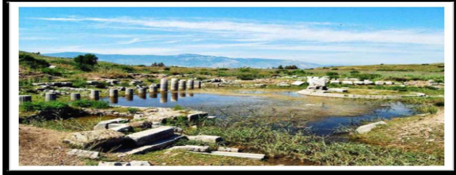
الشكل 1: نافورة الحوريات في روما تدور حولها الأساطير في تحقيق الأمنيات

وقصة الخلق وتشكيل السموات والأرض والمحيطات اعتمدت على الماء فهو يشكل 70% من مساحة اليابسة ووجوده أصبحت إمكانية الحياة دون سائر الكواكب الأخرى ممكنة فهو يملأ المحيطات والبحار والأنهار ويوجد في الهواء حتى باطن الأرض فيه ماء فجميع علماء الطبيعة والكيمياء أكدوا على أهمية عنصر الماء في البيئة الطبيعية من حولنا فعلماء الإغريق كتاليس ومن بعده ايمبيدوس اعتبروه المكون الرئيسي في بناء الكون وأن الأرض قد انبثقت من الماء وجميع الحضارات العظيمة قامت على ضفاف الأنهار كبابل وأشور على الفرات ودجلة ، والفرعنة كان النيل يمثل لهم رمزاً عظيماً وقدموا القرابين له وقاموا بالبحيرات المقدسة في المعابد على ضفافه ، وكان للنهر في حضارة الجانج في الهند خصائص دينية رمزية الشكل 1.