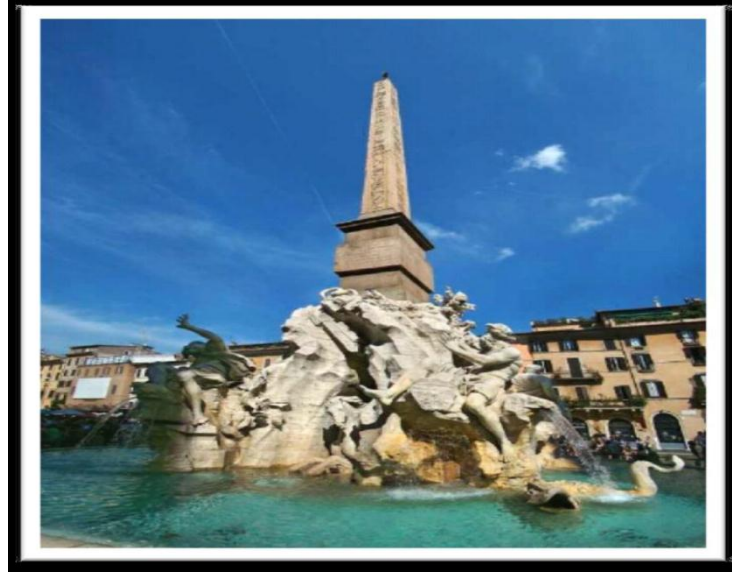
الشكل 8: نافورة الأنهار الأربعة في ساحة نافونا - روما - إيطاليا

حديثاً في الأماكن العامة في المدن استخدمت النافورات لترطيب الجو وإضافة لمسة جمالية وقيمة رمزية لتكريس الأحداث وقيم المجتمع والتأخي والتعاون بين البشر كنافورة يونيسفير كوينز في مدينة نيويورك وقد حملت شعار السلام من خلال التفاهم وركزت على فكرة السلام والتعاون المتبادل بين الشعوب .