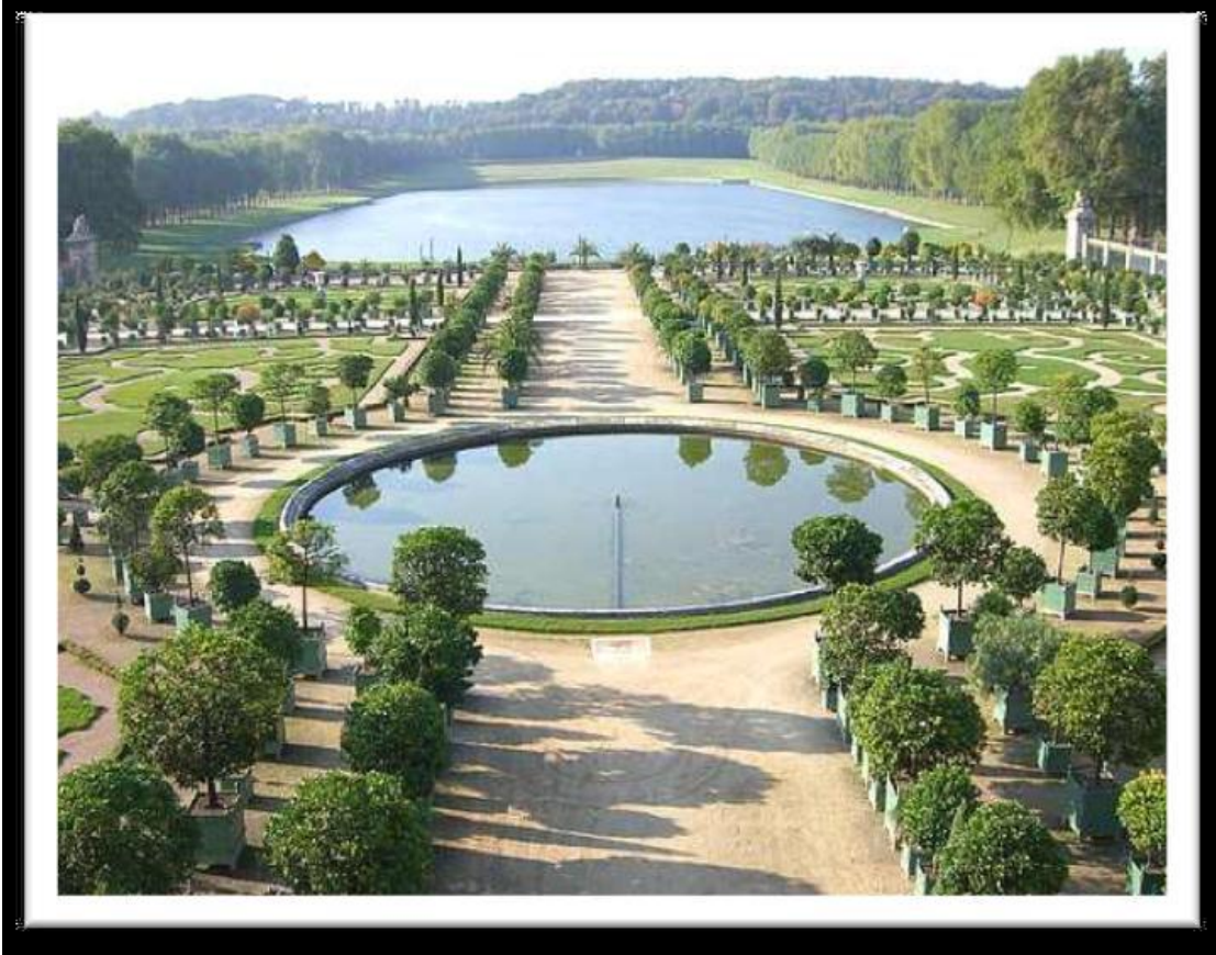
الشكل 3: الحوض المائي في قصر فرساي - فرنسا