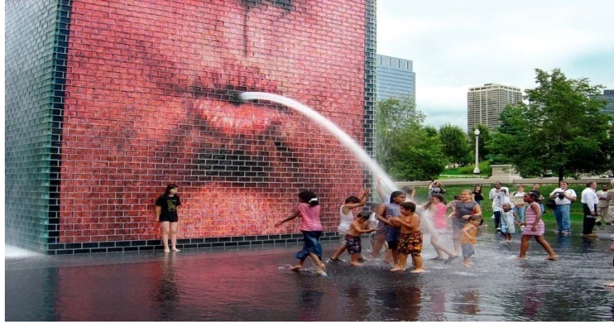
الشكل 16: نافورة التاج - شيكاغو