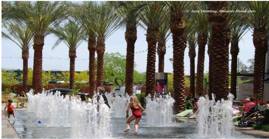
الشكل 17: مناهل الأرض في مدينة فينيكس في ولاية اريزونا