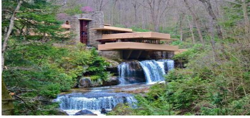
الشكل: بيت الشلال لفرانك لويد رايت