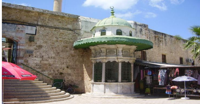
الشكل 11: سبيل لشرب المياه في عكا

شتى أنواع الحدائق والقصور فأقام شبكة تصل المصدر المائي بشتى أنواع النوافير التي تزين بها البرك والاحواض المائية وكذلك كان الاتراك العثمانيين يعتقدون ان المياه الراكدة غير طاهرة وغير مقبولة من الناحية الدينية فقد استعملت المياه الجارية ولذا كثرت النوافير متعددة الطوابق او السلسبيلات متعددة الاحواض الشكل 11.