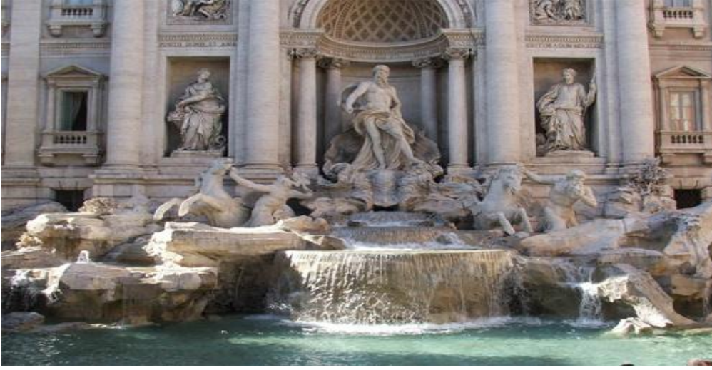
الشكل 15: نافورة تريفني - روما

إضافة مصدر صوتي مميز او محبب يخفض ادراك الانسان للضوضاء مثل استخدام النافورات والشلالات في الفراغات العامة مصممة لتوليد أصوات عالية تغطي على الضوضاء وذلك بالاعتماد على الموسيقى كما في نافورة السحر في برشلونة او استعمال قوة المياه وسحر الطبيعة كما في نافورة تريفني الشكل 15، في روما حيث تعثر على النافورة بعد ان تجتاز العديد من الشوارع الضيقة المتعرجة وتعد بحد ذاتها عملاً فنياً رائعاً ويمكنك سماع وجودها بالفعل من الشوارع المجاورة حيث صوت المياه المتدفقة ينمو باستمرار اكثر فاكثر ويصل الى أوجه في الساحة حيث صوت الماء يملأ الفضاء ويستمكن من العثور على اكثر مشهد لالتقاط الانفاس وانت تقف امام التمثيل الرمزي لهذه القوة العظيمة الطبيعة، ربيع صاخب ويبدو ان العمارة نفسها تتبض بالحياة من خلال المياه النشطة واثار الضوء والظل على الرخام جعل صوت الرياح يبدو عالياً من خلال التماثيل وحركة المياه مما خلق مشهد مكثف للغاية ومذهل .