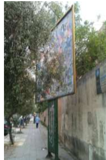
الشكل (9 أ) توضع غير مناسب للوحة اعلانات بسبب وضعها موازية لحركة السير، ووجود شجرة تحجب سطح اللوحة. ( تصوير الباحث).