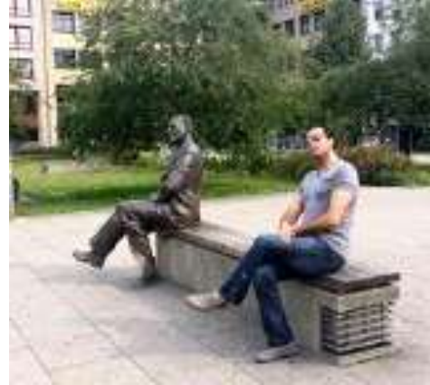
الشكل: (6) نماذج لأعمال فنية من البرونز تظهر عملية التفاعل بين السكان والعمل، تجميع الباحث.

كمثال على أهمية المكان يمكن ان نتحدث عن الاعمال النصبية التي انتشرت في بعض الشوارع منذ سنوات قليلة، وهي نتاج بعض الملتقيات الفنية لبعض الفنانين التشكيليين السوريين، هذه الأعمال نفذت حسب رؤية الفنان، وضمن حدود الامكانيات المتاحة (مثل مادة التنفيذ، الزمن المخصص للمنتقى، والامكانيات المتوفرة... الخ)، لكن دون اي حساب للموقع الذي سيوضع به العمل لاحقاً، ولذلك عندما تم توزيعها ضمن المدينة جاءت غريبة عن المكان من حيث الموضوع والشكل والتوافق مع المحيط وهي عناصر اساسية لا يمكن اغفالها بالنسبة لأي عمل فني.