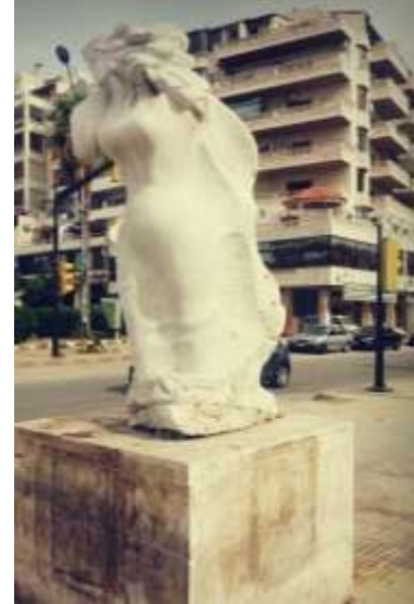
الشكل (8 أ) نصب نحتي منطقة الكورنيش الغربي.