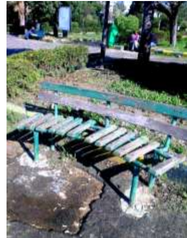
الشكل: (11 أ) مقعد من حديقة العسافيري