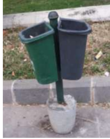
الشكل: (12 أ) سلة مهملات. الشكل: (12 ب) حاضن اشجار [3].