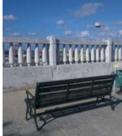
الشكل: (3 ب) حاجز من مدينة سيدني Sydney, Australia يلعب