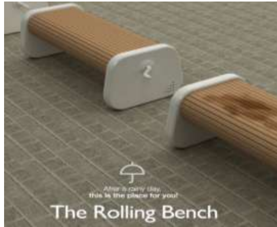
الشكل (1) نجد ان همّ المصمم تركز على ايجاد حل لبلال المقاعد بعد المطر وامكانية استخدام الجهة السفلية من المقعد عن طريق تدويره الى الاعلى [11].

يقوم التصميم الناجح على فهم المصمم العميق لعدد من الاسس والعناصر أهمها، الوظيفة والمواد المستخدمة والمكان والمستخدم.... الخ.