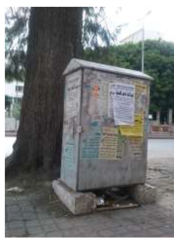
الشكل: (10) بعض اشكال التشويه والاهمال الذي تتعرض له اغلب مفروشات الشارع، ( تصوير الباحث).

الاعتقاد الشائع لدى كثير من الناس بأن الممتلكات العامة هي مشاع، هذا القصور في الرؤيا والفهم يصبح مرادف لعدم المسؤولية، ويتضح ذلك من خلال المواقف السلبية تجاه كل اشكال التعديات التي تتعرض لها، وهو ما يفتح الباب لمن يريد العبث بتلك المفروشات وممارسة جميع اشكال التعديات التي تتجلى في اغلب الاحيان بالتكسير والتخريب والتشويه، الشكل (10).