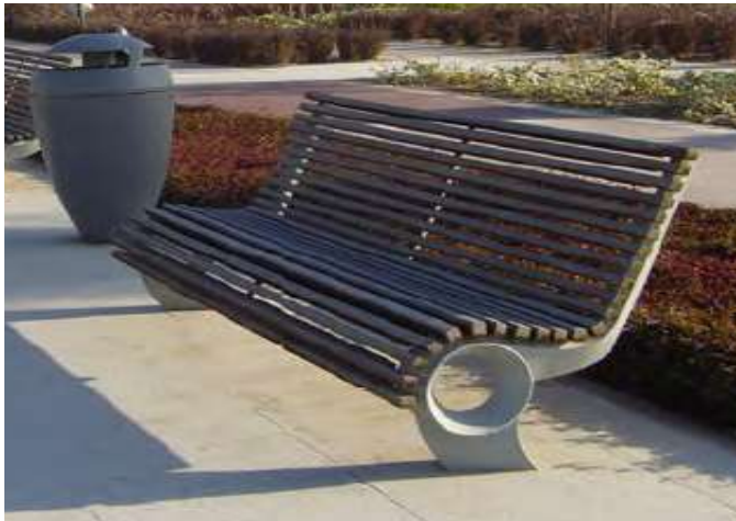
الشكل: (11 ب) مفروشات مختلفة (مقعد، سلة مهملات)، [8].

تحتاج مفروشات الشارع الى عمليات تركيب خاصة تتجاوز ما هو مألوف من حفر حفرة ثم ملئها بالإسمنت، وهو ما نقوم به تقريبا لتركيب جميع عناصر الفرش العمراني، هذا وان كانت تلك العملية لا تتم بهذه البساطة فإنها يجب ان لا تكون معقدة ومربكة وتحتاج الى الكثير من الاشغالات، المهم في عمليات التركيب هو انه يجب ان تكون مدروسة وموضحة بمخططات تنفيذية بشكل تفصيلي وموضوعة من قبل المصمم، اغلب مشاكل التركيب تتمحور حول اهمال لبعض التفاصيل التي قد تبدو للأشخاص الذين يقومون بتلك العملية أنها قليلة الاهمية، وهذا يعود لأسباب عدة من أهمها: