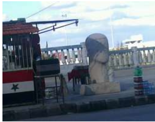
الشكل (7 أ) عمل من الكورنيش الغربي يخدم الكشك الموضوع الى جانبه فقط، وهو عمل غير مشاهد من اي اتجاه تقريبا.

ولو اجرينا مقارنة بسيطة بين العاملين الموضحين في الشكل (8 أ- و 8 ب) لوجدنا ذلك واضحاً، ففي الشكل (8ب) صيادي الشباك، يتبين لنا بوضوح تام أهمية تلك الملاحظة ونستطيع ان نجزم بأن العمل خلق لذلك المكان ولا يمكن ان يناسب مكاناً آخر بمواصفات مختلفة، ففكرة العمل (صيادي الشباك) تتسجم مع الشاطئ ويدعم ذلك حركة العمل نفسه، فهؤلاء الاشخاص الذين يقفون على صخور الشاطئ على بعد بضعة أمتار من مياهه يحتاجون