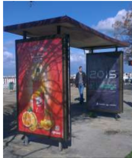
الشكل (2 أ) موقف باص من منطقة الكورنيش الغربي. الشكل (2 ب) قد تكون البساطة أهم مقومات التصميم الناجح.[9]

• تتنوع عناصر فرش الشوارع وتتعدد بشكل كبير وغالبا ما يتوضع العديد منها في مكان واحد، لذلك فمن الطبيعي ان يقوم كل عنصر بأداء دوره بالشكل والطريقة المحددة مع الأخذ في الحسبان أن يمكن العناصر الاخرى من اداء وظائفها ايضاً، فهي مهما تعددت وتنوعت تبقى موجهة لخدمة السكان. الشكل (3 أ ب). ونظراً لهذا التعداد والتنوع الكبيرين فإنه من المفضل التوجه نحو الجمع بين عدد من العناصر لتشكيل كتلة واحده تكون متعددة الاستعمالات multi-functional، الامر الذي يخفف من التلوث البصري الذي تنتجه بسبب الانتشار الواسع والكثيف واشغالها لكل الارصفة والممرات، الشكل (4).