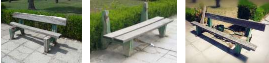
الشكل (14): ثلاثة مقاعد مهمة لنموذج واحد من المقاعد المنتشرة ضمن حرم جامعة تشرين.

هذه العمليات تسهل على العاملين في البلديات وضع خارطة لتوزيع مفروشاتها ضمن مختلف احياء المدينة، وبالتالي الاشراف عليها ومتابعة اجراء الاصلاحات والصيانة الدورية اللازمة.