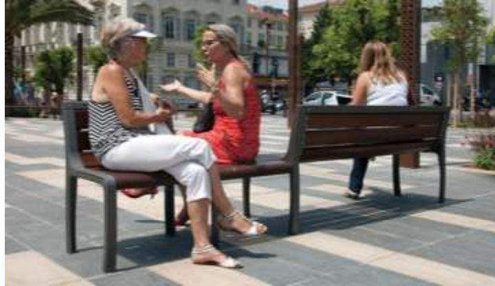
الشكل: (13) مقعد من الحديد والخشب يظهر أهمية التصميم والتنفيذ والتركيب [6]

في اغلب الدول تقوم البلديات بوضع رقم ( Code ) لكل قطعة من المفروشات التي تتوزع في شوارعها، وهذا الرقم هو بمنزلة بطاقة تعريف ID بالمنتج، يشير الى البلدة والحي ومن ثم الشارع فنوع قطعة الاثاث ثم رقمها المتسلسل، مثال الرقم 010511B7144 يشير الى: