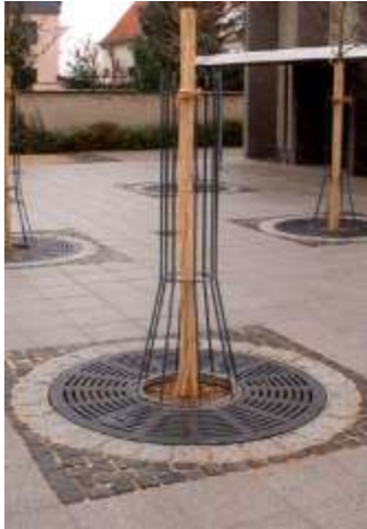
الشكل: (15 ب) نموذج لحاضن اشجار يمثل الوضع الطبيعي. [2]

المتروكة في الشوارع وقد نزعَت الاسلاك التي كانت تحملها إلى كثير من الحالات المشابهة الشكل (14-15 أ).... أهمية عملية الاستبدال تكمن أنها تضيف على المنطقة شعوراً بالتجدد والراحة خصوصاً أن اغلب تلك العناصر اذ ما اهملت شكلت عامل خطورة كبير على مستعملي الارصفة والساحات التي تتواجد فيها كونها غالباً ما تكون من الانابيب والقضبان المعدنية التي تحتاج الى ادوات خاصة لإزالتها.