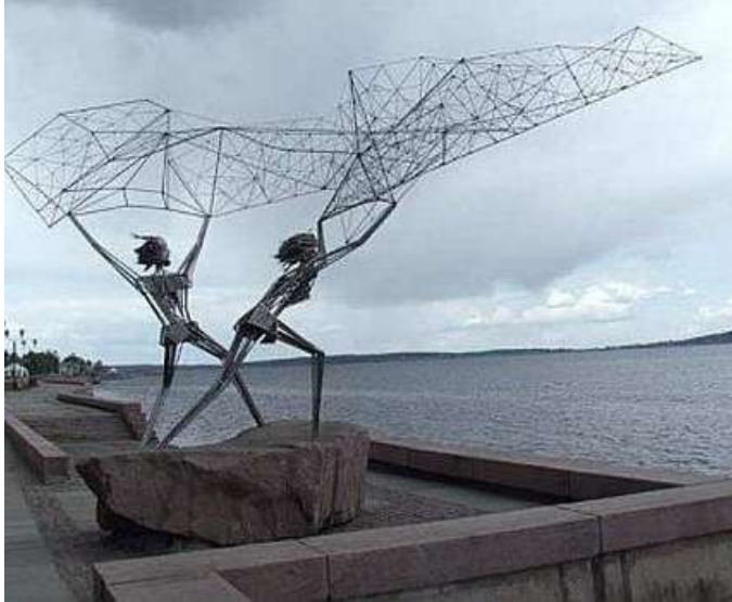
الشكل (8 ب) صيادي الشباك عمل نصبي من الصفائح والقضبان المعدنية

الى تلك الحركة القوية لإيصال شباكهم الى الماء، العمل الاخر الشكل (8 أ) للفنان أنور رشيد (ملتقى المدينة الرياضية، اللاذقية 2002 ) وضع في منتصف الشارع، ضمن حركة مرور السيارات، بعيداً عن حركة مرور المشاة، وهو بذلك بعيد عن نطاق الرؤية وقليل المشاهدة، اضافة لذلك نجد انه لاوجود لأية علاقة بين موضوع العمل والمكان الذي وضع فيه وان كان مشابها لمكان العمل الاخر، هذه المشكلة موجودة في جميع شوارعنا، ليس فقط في توضع النصب والاعمال الفنية، وإنما في توضع مختلف أنواع مفروشات الشارع.