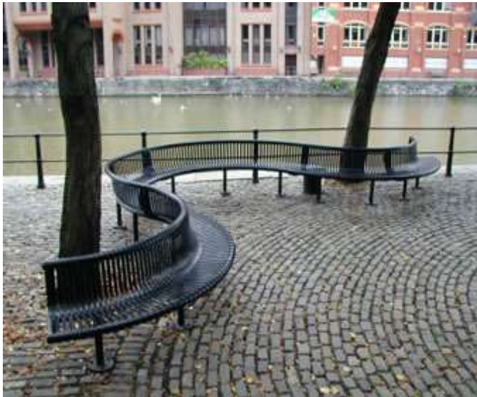
الشكل (9 ب) خصوصية المكان تستدعي مقعد بقياس غير اعتيادي، صمم ونفذ منسجماً مع المكان من حيث الشكل والحجم والمواد [8].