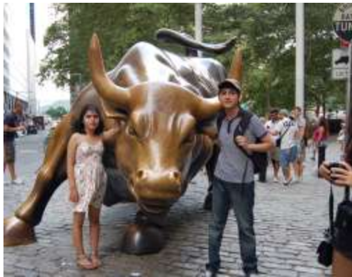
الشكل (7 ب) تمثال من البرونز في وسط شارع wall street في نيويورك 1987 للنحات Arturo Di Modica، وهو رمز لقوة وجموح الاقتصاد الأمريكي [10].

كمثال على أهمية المكان يمكن ان نتحدث عن الاعمال النصبية التي انتشرت في بعض الشوارع منذ سنوات قليلة، وهي نتاج بعض الملتقيات الفنية لبعض الفنانين التشكيليين السوريين، هذه الأعمال نفذت حسب رؤية الفنان، وضمن حدود الامكانيات المتاحة (مثل مادة التنفيذ، الزمن المخصص للمنتقى، والامكانيات المتوفرة... الخ)، لكن دون اي حساب للموقع الذي سيوضع به العمل لاحقاً، ولذلك عندما تم توزيعها ضمن المدينة جاءت غريبة عن المكان من حيث الموضوع والشكل والتوافق مع المحيط وهي عناصر اساسية لا يمكن اغفالها بالنسبة لأي عمل فني.