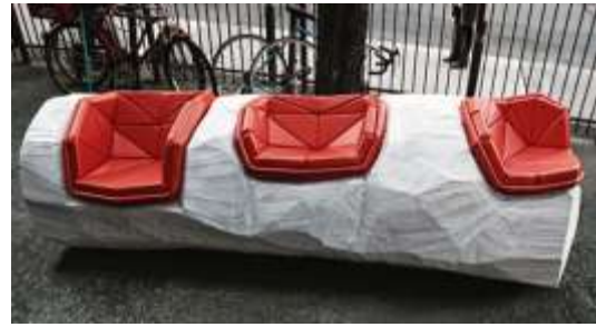
الشكل (5) عناصر مختلفة (مقعد، موقف باص) من الصفائح المعدنية والبولي كربونات والالياف الزجاجية. [6]-[5].

ت-المكان: من الطبيعي ان تتوزع مفروشات الشارع على اختلاف أنواعها واحجامها في الساحات والحدائق وعلى طول الممرات والارصفة، لكن لكل مكان خصوصيته واحتياجاته، وهذا عائد بشكل اساسي لتقديرات الاختصاصيين الذين يقومون بدراسة كامله لكل منطقته على حدا، هذه الدراسة تشمل جوانب متعددة، مثل الكثافة السكانية، خصوصية المكان وأهمية الموقع، مع الاخذ بعين الاعتبار للكثير من المعطيات التي تخص سكان المنطقة... لتصل في النهاية الى مجموعة من النتائج يتحدد من خلالها كمية ونوعية العناصر اللازمة لكل موقع، والتي يجب ان تنسجم مع المكان من الناحية الشكلية والوظيفية، ومع التأكيد على أهمية تلك الدراسة، الا أنها تبقى اكثر أهمية بالنسبة لعناصر محده وذلك لأهمية المكان المناسب في تعزيز قيمة الدور الايجابي للعنصر والذي قد يكون جزء من التصميم نفسه.