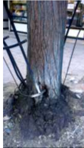
الشكل: (15 أ) حاضن احدى الاشجار وضع لحماية الغرسة الصغيرة لكنه ترك لأكثر من عشر سنوات فانغرس داخل لب الساق، ( تصوير الباحث).