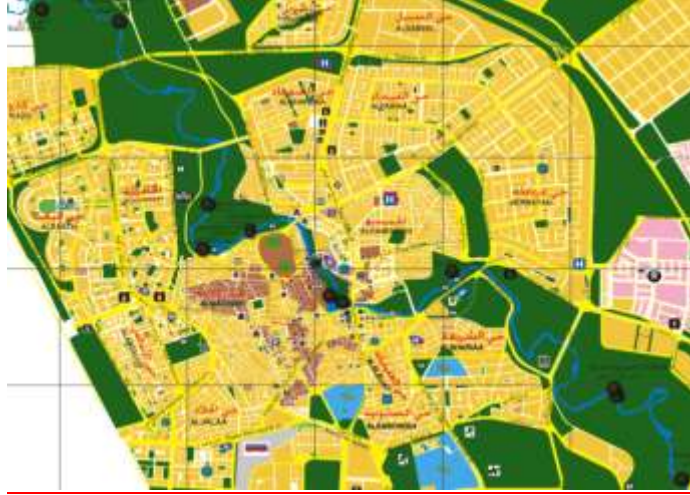
الشكل (9) مخطط سياحي لمركز مدينة حماة موضح عليه مواقع النواير على ضفاف العاصي

2. قلعة حماة : تقع فوق جسر الهوى ( جسر الرئيس حالياً ) في وسط المدينة ضمن بقعة سياحية ممتازة وهي نواة المدينة وأصلها الأول ، فهي تحبى بين حناياها آثاراً عائدة إلى الألف السادس قبل الميلاد . وقد أقيم في هذه القلعة منتزه كبير يليق بالسياح والزوار ويسمح لهم بقضاء أحلى الأوقات وأمتعها من خلال إطلالة على المدينة بكاملها.