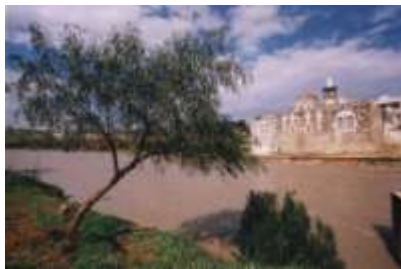
الشكل (11) يوضح جامع أبي الفداء

4. جامع أبي الفداء : ومن اسمه نعلم أن بانيه هو الملك أبو الفداء مؤيد الدين إسماعيل . يضم هذا الجامع قبر الملك ذاته ، كما عثر فيه على لوحة فسيفسائية رائعة مع تضيفيرات رخامية رائعة.