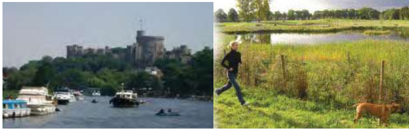
الشكل (4) ممارسة المشي والتنزه على ضفاف التايمز[9]

يمكن للأشخاص الذين يقومون بالسياحة النهرية أن يوقفوا المراكب الخاصة بهم في أماكن معينة لتناول الأطعمة والمشروبات على ضفاف النهر كما يمكنهم أن يقوموا بالوقوف عند نقط محددة في بعض الحدائق على النهر للقيام بشوي اللحوم وما خلاف ذلك ,بالإضافة لذلك فهناك العديد من المطاعم المختلفة الأحجام والأنواع التي تقوم بتقديم الأطعمة والمشروبات على ضفاف النهر