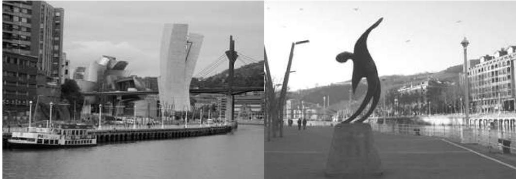
الشكل (7) الرحلات النهرية للمتاحف والمعارض المكشوفة على ضفاف نهر النيرفيون [10]

المعارض والمتاحف كانت أيضا من نقاط الجذب التي ارتبطت بالرحلة النهرية على ضفاف التايمز، وضفاف نهر النيرفيون في مدينة بلباو مثل متحف جوجينهايم وهو من أهم المشروعات التي أقيمت على ضفاف النهر حيث تمت مراعاة علاقتها بمسارات الحركة الآلية ومسار المشاة الرئيسي على ضفة النهر. وتم الاهتمام بالعلامات المميزة والتشكيلية حيث وضعت في أماكن التجمعات ونقط الالتقاء والساحات وأمام مباني المتاحف والمسارح (5) (6)