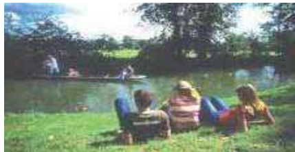
الشكل (5) إحدى المتنزهات على ضفاف نهر كمبرل[4]

مثال آخر هو نهر كمبرل في (فانك . وفر) في كندا حيث تقوم جمعية " Campbell river tourism " بتنظيم المعسكرات على ضفافه، بالإضافة إلى تنظيم رحلات ترفيهية للقوارب موزعة على اثني عشر متنزه، وثلاث ملاعب للجولف، وهي جمعية لا تهدف للربح تقوم بإدارة واستثمار مقومات النهر المختلفة في السياحة النهرية ولديها منطوعين من كندا وخارجها(3)