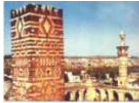
الشكل (10) يوضح الجامع الكبير

3. الجامع الأعلى الكبير: المنشآت الدينية الإسلامية تشكل الجزء الهام من تاريخ حماة وعظمتها ، حيث تكثر فيها الجوامع القديمة التي تشهد توالي المديريات على تلك المدينة ففي هذا الجامع تظهر آثار حضارات متغايرة في اللغة والعنصر والدين (كالمسيحية و الإسلامية ) وهو على الترتيب خامس المساجد الإسلامية يقع في حي المدينة جنوب غرب القلعة وأهم معالمه مؤذنتاه الشمالية والجنوبية ومنبره الخشبي المزخرف