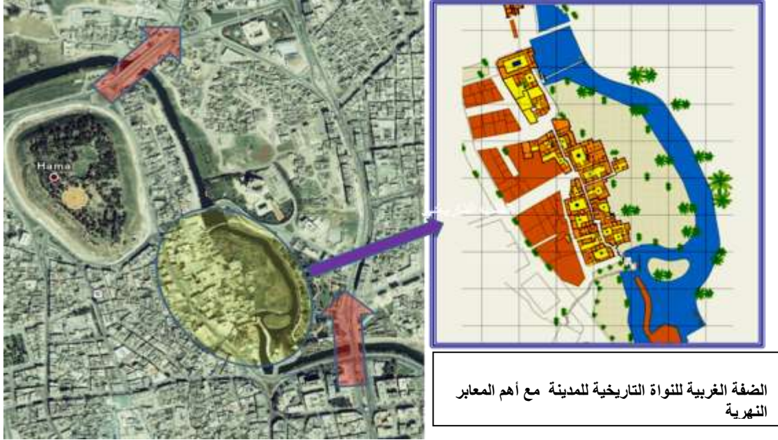
الشكل (13) يوضح النواة التاريخية لمركز المدينة (الباحث)