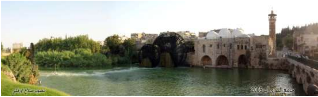
الشكل (12) يوضح الجامع النوري

5. جامع النوري : عثر فيه على منبر أثري أجمل آيات الجمال والروعة والإبداع والذوق . كما يتميز هذا الجامع بمئذنته المربعة الشكل وكتاباته التاريخية الهامة.