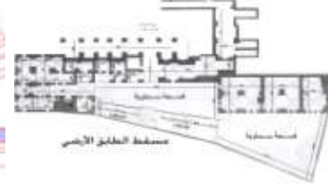
الشكل (15) يوضح مخطط قصر الأرنؤوط (الباحث)