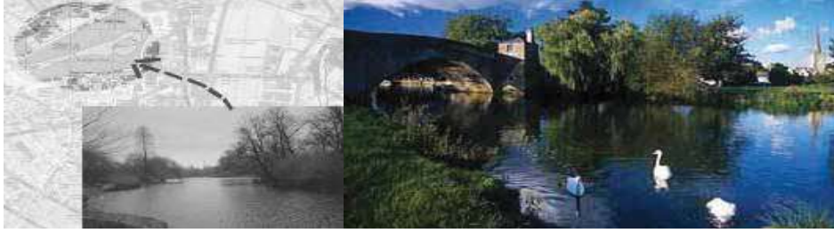
الشكل (3) سانت جيمس بارك [3]

نهر التايمز يوفر ملجأ جيدا للحياة الطبيعية بأنواعها ,وهو محورا ايكولوجيا هاما يساعد على حركة الحياة البرية, فهناك العديد من الحيوانات البرية التي يمكن رؤيتها على طول مجري النهر ,والتي يجب ألا تتعرض لتأثيرات تضطرها إلى الخروج من تلك البيئة الصالحة إلى مكان آخر للتعايش ,ومثال لتلك المناطق سانت جيمس بارك. نهر التايمز يحتل بعض الأهمية في فصلي الربيع والخريف وهي فترات هجرة بعض الطيور المهاجرة في أنحاء أوروبا , ومحوره يقع في مسار هجرة بعض الأنواع من الطيور ,تم تحديد ثلاث مناطق منها إلى ذلك فان الحكومة والسكان لديهم الوعي البيئي الكافي بأهمية المورد الرئيسي لهم وهو مياه النهر وبالتالي أصبحت تلك المناطق نقاط جذب للرحلات النهرية(3)