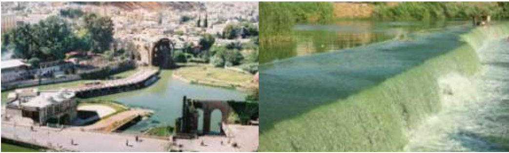
الشكل (8) يوضح موقع نهر العاصي بالنسبة لمركز المدينة (الباحث)

تقع محافظة حماة في المنطقة الوسطى من سورية وتبعد حوالي 200 كم عن العاصمة دمشق شمالاً و 70 كم عن الشاطئ الشرقي للبحر الأبيض المتوسط غرباً، وهي مزيج رائع من البوادي والسهول والجبال التي ينساب خلالها نهر العاصي بشريطه الأخضر الممتد بطول 171 كم. تبلغ مساحة المحافظة /11000/ كم2 مربع تشكل المدينة وريف المركز التابع لها مباشرة 3680 كم2 أي حوالي ثلث المساحة الإجمالية للمحافظة. ويبلغ عدد سكانها حوالي 2 مليون نسمة . وتعتبر من أهم المناطق السياحية السورية على الإطلاق وذلك بسبب التنوع الحضاري والثقافي والطبيعي فيها. و تشتهر محافظة حماة بنهر العاصي الذي يجري فيها وبعد ثاني أنهار سورية أهمية بعد نهر الفرات ويخترق أراضي المحافظة من جنوبها إلى شمالها ويمثل المصدر المائي الرئيسي للزراعة فيها .