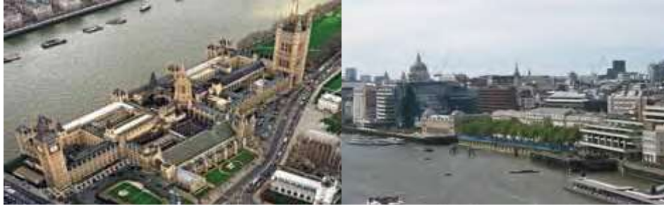
الشكل (1) من المناطق التاريخية على ضفاف التايمز منطقة ويستمنستر والبرج [3]

نهر التايمز هو محور التقاء المباني والمناطق التاريخية في مدينة لندن، ويكفي القول أن هناك منطقتان علي نهر التايمز مصنفتان ضمن المناطق التراثية الواجب الحفاظ عليها في العالم كله وعددها عشر مناطق، هاتان المنطقتان هما ويستمنستر ومنطقة برج لندن، وقامت الحكومة البريطانية عام 1995 بتحديد الأماكن والمباني التاريخية الواجب الحفاظ عليها من خلال إستراتيجية الحفاظ على النهر (2)