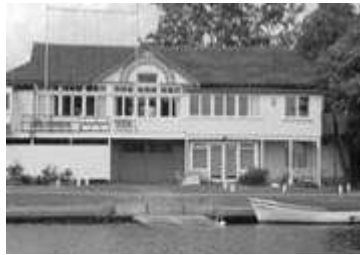
الشكل (6) الفيلات السكنية على ضفاف النهر [3]

تم مراعاة أن تكون هناك محطات لوقوف المراكب على مقربة من الفنادق والتي تتراوح مستوياتها من الفنادق الخمس نجوم إلى الموتيلات الصغيرة، إضافة إلى ذلك فهناك عدة نماذج أخرى للإقامة النهرية كالعوامات النهرية واليخوت التي تتلاءم أسعارها مع عدة نماذج من شرائح المجتمع وذلك حسب أحجامها وتجهيزاتها، تم إقامة أيضا ثلاث موتيلات لإقامة الشباب على ضفاف النهر مرتبطة بخط سير الرحلات النهرية، وتم ربط هذه الموتيلات بشبكة المعلومات وذلك من أجل حجز الوحدات عن طريق المؤسسات والأفراد، كما تم توفير بعض العائمات واليخوت للإقامة لليلة واحدة على ضفاف التايمز، كما أن هناك بعض الوحدات السكنية كالفيلات التي يتم تأجيرها على ضفاف النهر (5)