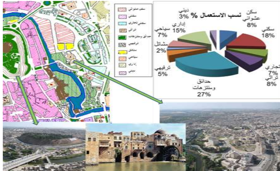
الشكل (14) مخطط استعمالات الأراضي ضمن مركز المدينة مع نسب الإشغال (الباحث)

تتنوع الاستعمالات فيها من الاستعمالات الإدارية كمبنى قيادة الشرطة ومبنى فرع الحزب إلى الحدائق والمنتزهات كحديقة أم الحسن ، والاستعمالات السياحية إذ تحتوي هذه الضفة على أضخم فندق في المدينة وهو فندق أفاميا الشام . ولكن في الجزء المقابل لقلعة حماة يوجد استعمال سكني عشوائي يمتد بمحاذاة الضفة الشرقية وصولاً لجسر باب الهوى، وقد قام مجلس المدينة برصف جزء من الكورنيش الشرقي وتجهيزه بمصاطب للجلوس