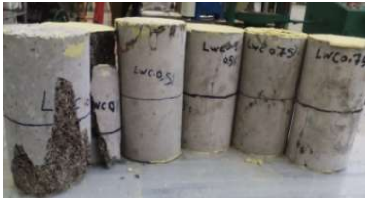
الشكل (4) نماذج انهيار العينات الاسطوانية على الضغط