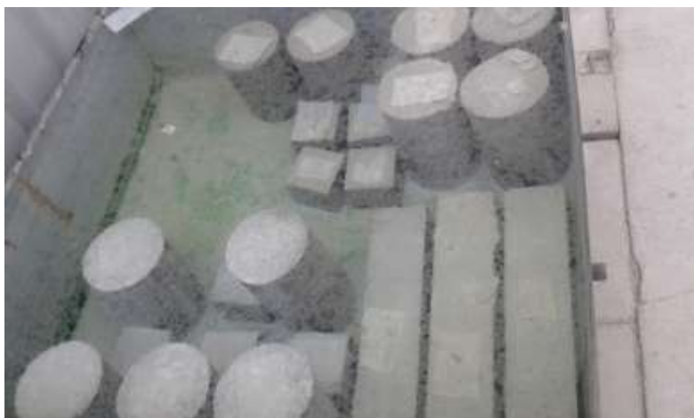
الشكل (1) بعض العينات المدروسة المحفوظة ضمن حوض الماء

تم وضع حصويات السكرية المجففة باستخدام الفرن (oven-dry) مع الماء الذي تمتصه الحصويات في خلاط آلي لمدة ربع ساعة، ثم أضيف الرمل الجاف والاسمنت والألياف الفولاذية (في حال وجودها) واستمر الخلط لمدة دقيقتين، بعدها أضيف ماء الخلط والملدن واستمر الخلط لمدة ثلاث إلى خمس دقائق أخرى لضمان الحصول على خلطة بيتونية متجانسة وتوزع جيد للألياف ضمنها. وضع البيتون الطري داخل قوالب الصب الفولاذية على طبقات بسماكة 5cm تقريباً واستخدمت الطاولة الرجاجة لرج العينات وضمان خروج الهواء منها ثم تمت تسوية سطحها. فكت القوالب بعد 24 ساعة ووضعت في الماء حتى وقت الاختبار كما يبين الشكل (1). وللحصول علنك من المقاومة على الضغط ومعامل المرونة وإيجاد العلاقة بين الإجهاد والتشوه في عمر 28 يوماً حضرت ثلاث اسطوانات بأبعاد (300X150)mm، كما حضرت ثلاث اسطوانات بأبعاد (300X150)mm لتحديد المقاومة على الشد بالانفلاق. ولتحديد المقاومة على الشد بالانعطاف تم تحضير موشورين بأبعاد (100×100×500)mm، وذلك من أجل كل خلطة من الخلطات المدروسة.