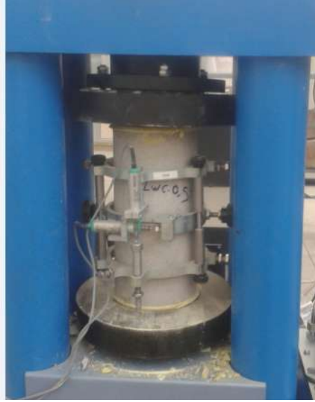
الشكل (2) عينة الاختبار ضمن جهاز الكسر

قيم الحمولات والانتقالات أثناء الاختبار ومن ثم تم حساب الإجهاد والتشوه الموافقين لكل حمولة مطبقة وتنظيمها في جداول Excel ومن ثم إيجاد العلاقة (إجهاد- تشوه) لكل عينة اختبار.