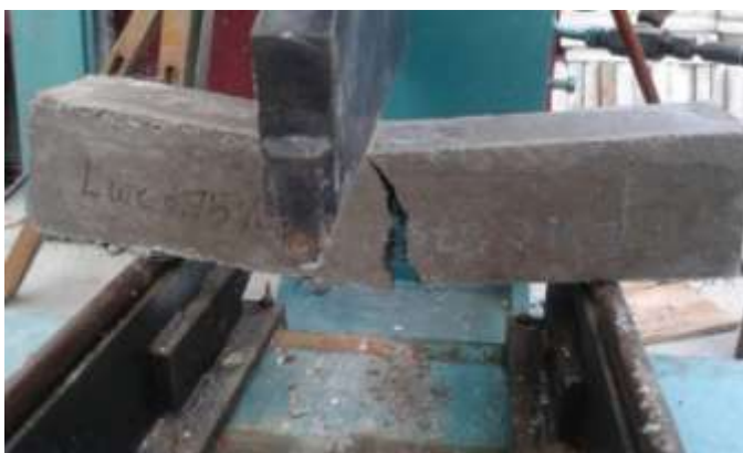
الشكل(5)نمط الانهيار وتشكل الشقوق في العينات الموشورية تحت تأثير الانعطاف