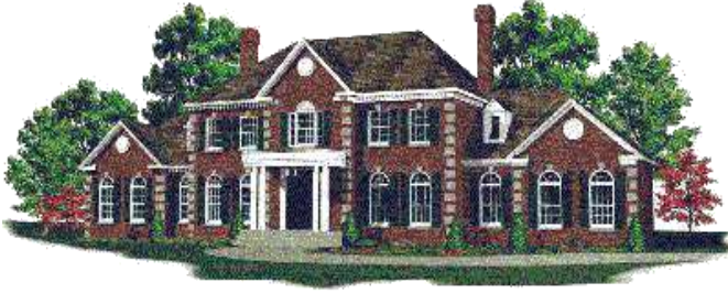
واجهة أكاديمية ( سكن )