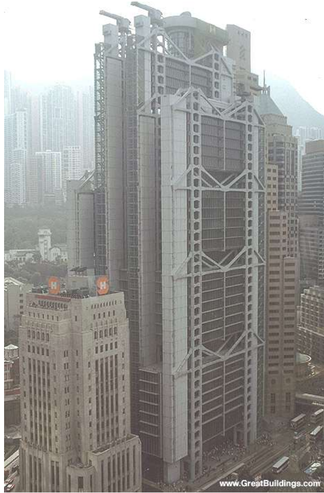
بنك شانغهاي - هونغ كونغ - اليابان للمعماري (Norman Foster) . إظهار القوة الإنشائية في الواجهات واستخدام المعدنية الصريحة ، تعبير واضح عن مدى كثرة الوظائف الداخلية للمبنى ومدى العلاقات القوية بين هذه الوظائف . [ 5 ]