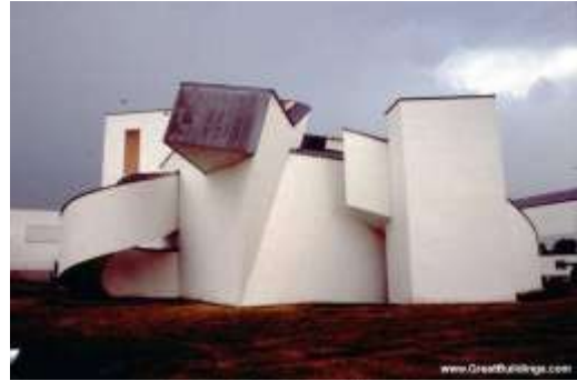
فانتازيا ( الفن التكعيبي ) في واجهات متحف المهندس المعماري ( Frank Gehry ) - ألمانيا - من التكوينات البارزة في الواجهات تتضح لنا صالات العرض وبالتالي استطعنا استقراء وظيفة المبنى [ 5 ]