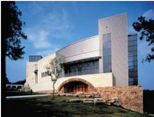
واجهة أكاديمية ( إداري - شركة )