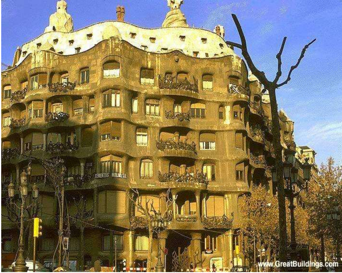
فانتازيا ( الخطوط الحرة ) بناء سكن وتجارة في مدينة برشلونة - أسبانيا - للمعماري الأسباني (Antonio Gaudi) وكذلك استطاع المعمار أيضا التعبير بواجهة البناء والمفردات المعمارية الموجودة في الواجهة عن وظيفة البناء الداخلية [ 5 ]