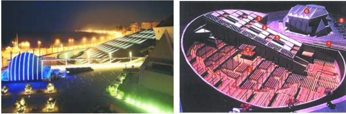
مكتبة الإسكندرية - مصر - الإسكندرية - (شركة Snohetta - أوسلو) ترمز إلى قرص الشمس والنور المنبعث منها إلى العلم والمعرفة والثقافة [ 4 ]