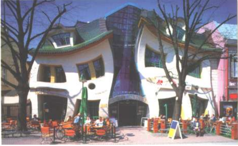
فانتازيا ( السريالية ) في واجهة بناء مؤلف من كافتريا وسكن - بولندا - سبوت - ( الباحث )