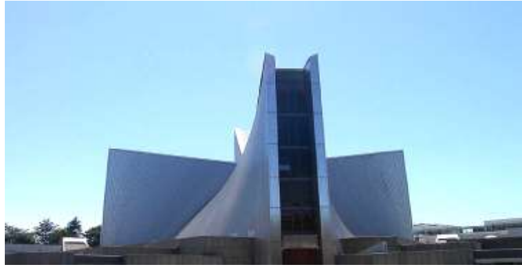
واجهة رمزية ( كنيسة في طوكيو ) شكل الصليب