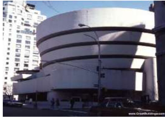
واجهة رمزية ( متحف )

وهكذا يمكننا التعبير عن أي شيء من خلال مشاهدتنا له وبالتالي نعطي وصف أولي عنه والوظيفة التي يؤديها.