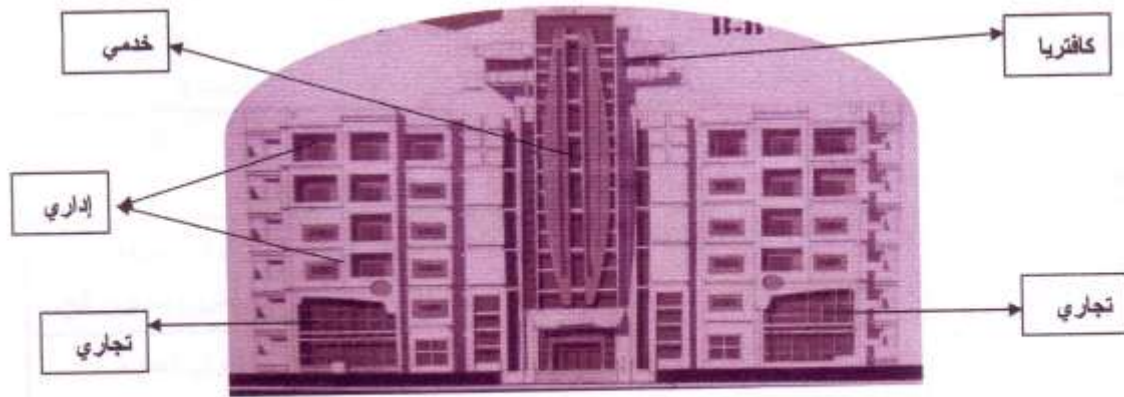
واجهة مبنى ( إداري - تجاري ) - عمل أكاديمي طلابي سنة ثالثة

مثلاً كأن يكون لدينا مشروع تجاري ومكاتب فكيف يمكن التعبير في الواجهة عن الوظائف السابقة.