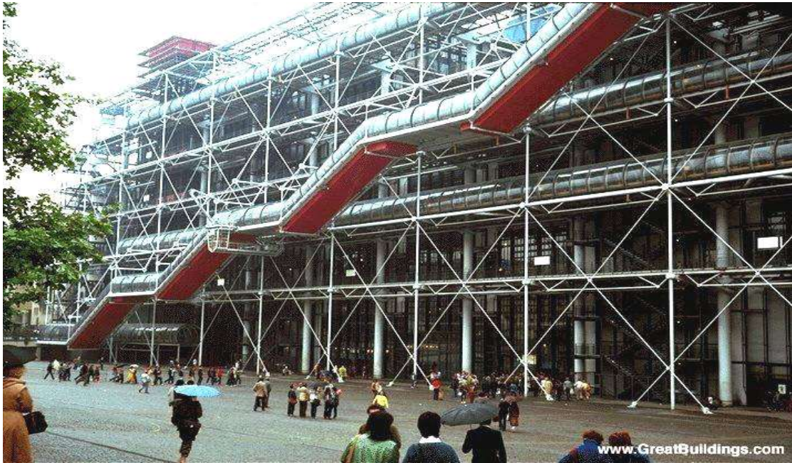
مركز بومبيدو الثقافي - فرنسا - باريس - للمعماريين (Rogers and Piano) ومدى تعبير واجهة المبنى ( الإنشائية المعدنية المعقدة ) عن الوظائف الداخلية الكثيرة التي يؤديها المبنى [ 5 ]

هذا النوع من الواجهات يعكس الوظيفة الداخلية للمبنى بطرق مختلفة ( الإنشاء ، مواد البناء، الإكساء....) ويكون لهذه الطرق الدور الأساسي للتعبير عن مكونات الوظيفة الداخلية للمبنى . بنظرة لمركز جورج بومبيدو في فرنسا ، فإنه للوهلة الأولى للناظر يوحي له المبنى وكأنه مبنى ذو وظيفة إنتاجية ( مصنع ، ورشة إنتاج ،... الخ ) . لكن استطاع المعمارين ( بومبيدو و روجرس بيانو ) التعبير عما يجري ضمن المركز من حركات وظيفية كثيرة بالمصنع الذي يحتوي الكثير من الوظائف ( وهذه الوظائف في المصنع لا تنعكس على واجهاته بشكل اعتيادي فغالباً ما تكون وجهاً المصنع بسيطة على عكس وظيفته الداخلية ) . وكذلك الحال عند نظرنا الأولى لبنك شانغهاي في اليابان للمعماري نورمان فوستر . فإن إظهار القوة الإنشائية في الواجهات واستخدام المعدنية الصريحة، استطاع أن يعبر عن مدى كثرة الوظائف الداخلية للمبنى ومدى العلاقات القوية بين هذه الوظائف .