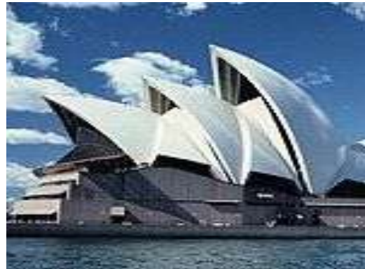
واجهة تعبيرية ( بيئية ) أوبرا