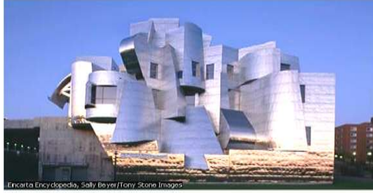
واجهة فنية ( الفن التكعيبي )