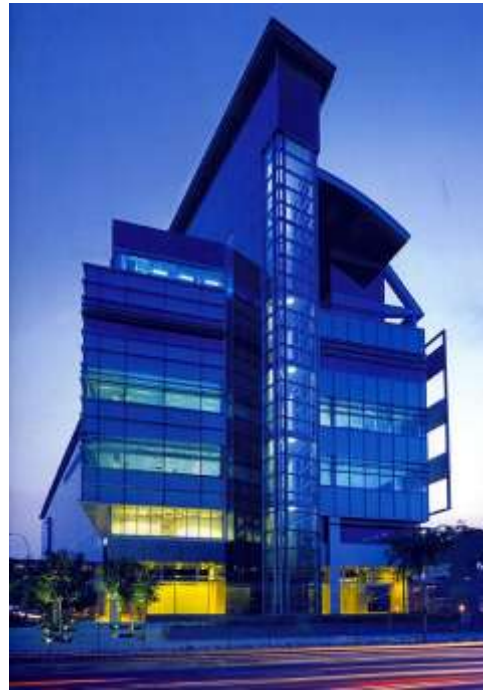
واجهة أكاديمية ( تجاري - مكاتب )