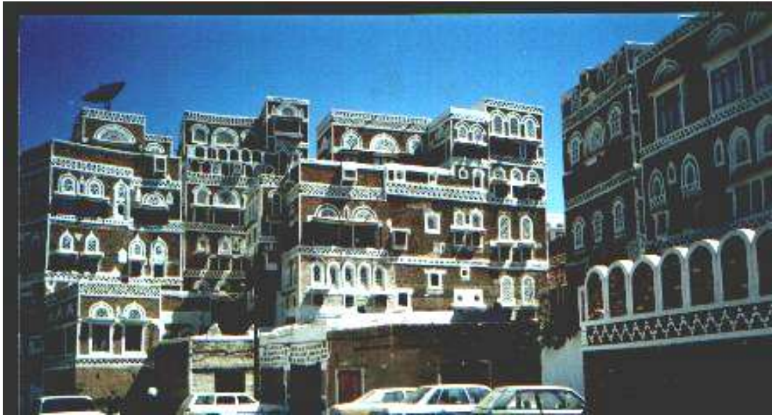
فانتازيا ( اللون والزخرفة ) مساكن يمنية - مدينة صنعاء - اليمن - ( الباحث ) التعبير عن الوظيفة الداخلية من خلال دراسة الفتحات الصغير والكبيرة ومدى زخرفتها .