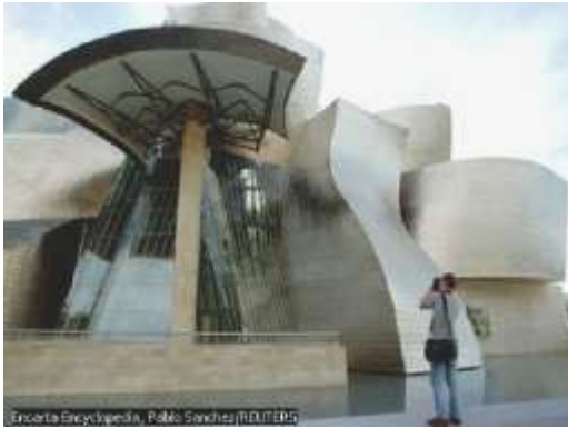
واجهة فنية ( متحف )