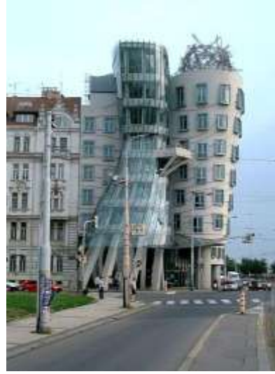
واجهة تعبيرية ( فندق )