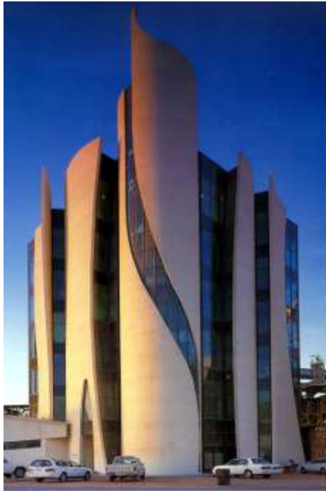
واجهة فنية ( إداري )