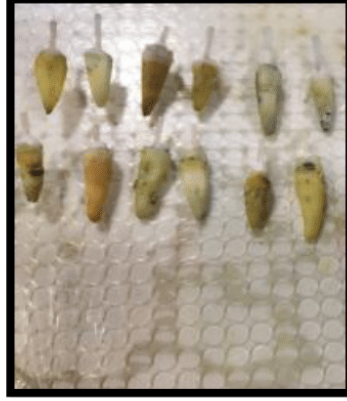
الشكل (7) يوضح توضع الأوتاد وإصاقها داخل الجذر.

ثانية ثم جفف غمد الوتد بأقماع ورقية بلطف لإبقاء العاج رطباً، وتم تطبيق عامل الربط داخل غمد الوتد وتصليبه باستخدام جهاز التصليب ذاته لمدة 15 ثانية وذلك مباشرة قبل تطبيق الإسمنت الراتنجي داخله.