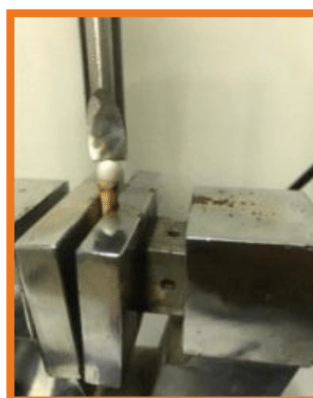
الشكل (10) اختبار القص

الاختبارات الميكانيكية لعينة القص: تم وضع كل مفردة على جهاز الاختبارات الميكانيكية بحيث تكون الزاوية بين رأس جهاز الاختبار وتاج الزيركونيا عمودية. تم تطبيق الحمل على المفردة بسرعة (5مم /دقيقة) حتى حدوث الكسر وتسجيل مكان الكسر.