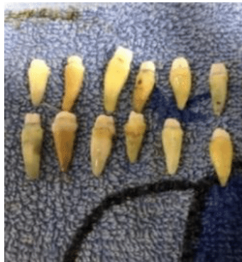
الشكل (8) بناء القلب من الراتنج