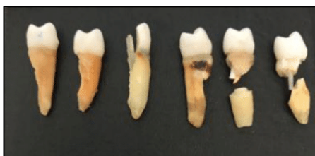
الشكل رقم (11) يبين نمط الفشل في عينة الإسمنت الراتنجي لإختبار القص