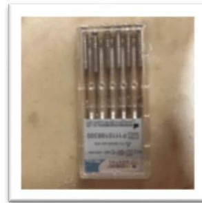
الشكل رقم (1) مبادر تحضير آلي