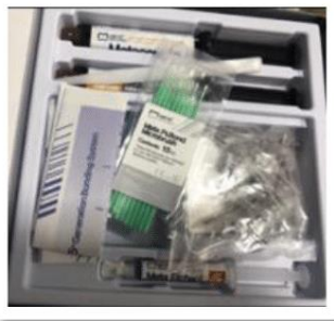
الشكل رقم (3) كومبوزيت