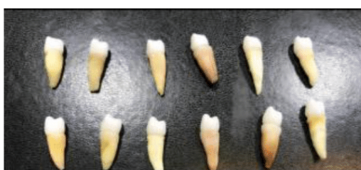
الشكل (9) تصنيع تاج الزيركونيا