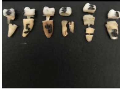
الشكل رقم (13) يبين نمط الفشل لعينة الإسمنت الراتنجي في اختبار الشد