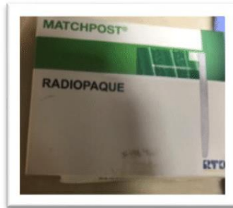
الشكل رقم (2) أوتاد راتنج مركب مقوّة