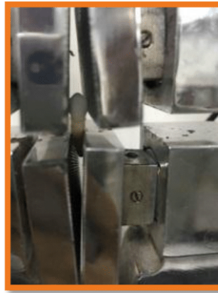
الشكل (12) يبين اختبار الشد

وضعت العينات على جهاز الاختبار حيث وضع رأس علوي للجهاز بحيث تكون قوة الشد فيه موازية لمحور الوتد، والرأس السفلي ثبت عليه المفردة بحيث يكون التاج خارج الرأس من الجهتين أجري الاختبار بحيث يتحرك رأساً الجهاز بسرعة (5مم/دقيقة) حتى حدوث الفشل، وتم تسجيل قيمة القوة بوحدة النيوتن والتي تمثل مقاومة الوتد لخروجه من غمد القناة.