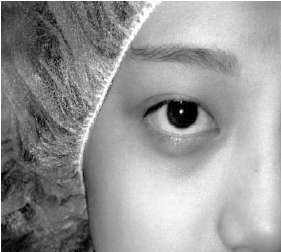
الصورة (1) تلاحظ وجود البردة في منتصف الجفن السفلي من ناحية الجلد

بحسب التجربة وكما ذكر في ادبيات طب العيون فإن المرضى يستجيبون بشكل جيد حتى لو لم يتم الحقن داخل الآفة مباشرة 1 وقد تم إجراء دراسة لاستقصاء فعالية حقن البيتاميتازون فوسفات الصوديوم خارج الآفة باستخدام طريق عبر الجلد كعلاج للبردة .