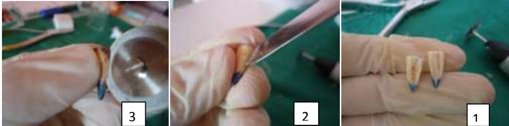
الشكل (3) 1- إجراء ميزابين بواسطة قرص فاصل . 2- استخدام الاسباتول لفصل الجذر .3- الجذر بعد فصله لقسمين .

بعد إزالة الضماد حشيت العينات في المجموعات D,C,B بطريقة التكتيف الجانبي باستخدام أقماع الكوتا بركا و أكسيد الزنك والأوجينول كما هو الحال في المجموعة A ( المجموعة الشاهدة ) وحفظت في الحاضنة بدرجة حرارة 37 درجة مئوية و رطوبة نسبية 100% لمدة 72 ساعة للسماح بتصلب المادة الحاشية واستقرار أبعادها . تم تطبيق طبقتين من طلاء الأظافر على كامل سطح الجذور باستثناء المنطقة المحيطة بذروة الجذر ( حوالي 2-3 ملم ) ، وضعت العينات ضمن وعاء زجاجي يحوي صبغة أزرق الميثيلين تركيز 2% وبحيث يتم غمر الجزء الذروي فقط للعينات المدروسة وبشكل كامل ضمن الصباغ ، حفظت العينات في الحاضنة بدرجة حرارة 37 درجة مئوية لمدة 7 أيام .أزيلت العينات ونظفت جيداً تحت الماء و تم شطر الجذور بالاتجاه الدهليزي اللساني حيث تم إجراء ميزابين على طول الجذر بواسطة قرص فاصل وبالسرعة البطيئة مع التبريد أحدهما على الجهة الدهليزية والآخر على الجهة اللسانية ثم فصل القسمين عن بعضهما بواسطة الاسباتول ، الشكل (3).