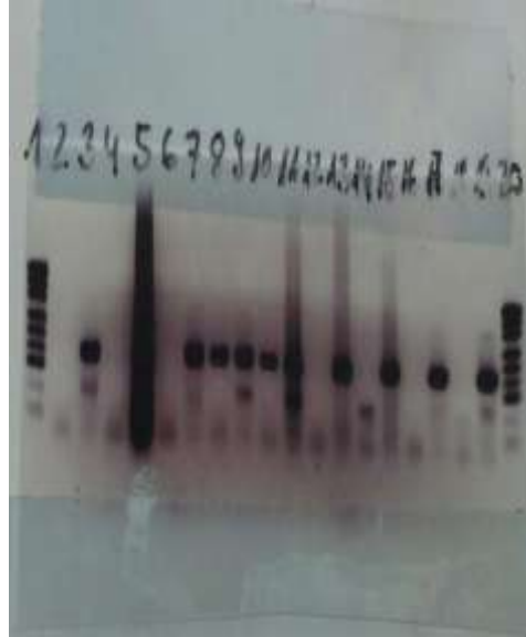
شكل 3: يوضح نتائج ال PCR: تعتبر ايجابي عندما يكون الطول 142 bp