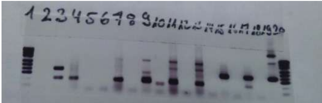
شكل 4: يوضح نتائج ال PCR: تعتبر ايجابي عندما يكون الطول 142 bp