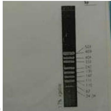
شكل 2: الدليل المستخدم لتحديد طول DNA ويقدر ب bP