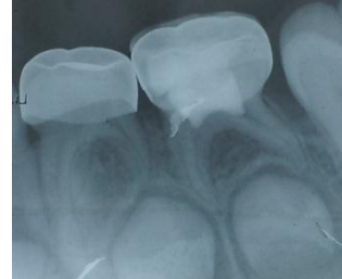
بعد 3 أشهر