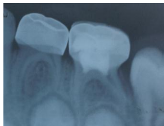
بعد 6 أشهر