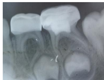
مباشرة بعد إصاق التيجان