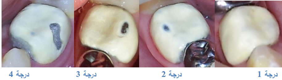
الشكل رقم (2) يبين درجات سلامة الوجوه/التقشر الأربعة.