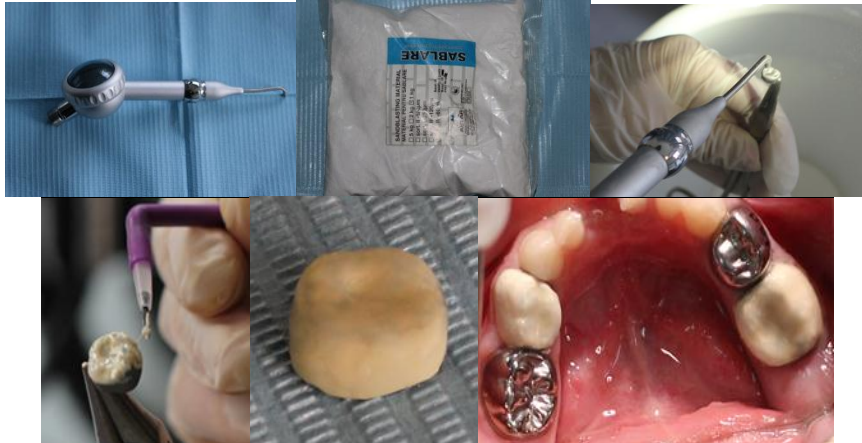
الشكل رقم (1): يبين مراحل تغطية تاج الستانلس ستيل بالكومبوزيت

شملت التغطية بالكومبوزيت السطحين الدهليزي والطاحن وجزءاً من السطح اللساني، وقد تم تطبيق نظام الربط (Ceramic Repair, Intro Pack, Ivoclar Vivadent) مباشرة بعد الترميل وابتداء تعليمات الشركة المصنعة [19]، إذ يتم أولاً بعد الترميل غسل التاج بتيار مائي ثم التجفيف بتيار هوائي، بعد ذلك يتم تطبيق Monobond plus باستخدام فرشاة ويترك لمدة 60 ثانية ليتبخّر، وبعد ذلك يُجفف بتيار هوائي ثم يتم تطبيق طبقة الـ Opaque على السطح المكيف لإخفاء اللون المعدني، والتصليب لمدة 40 ثا، بعد ذلك تُوضع طبقة رقيقة من الـ Heliobond على كامل سطح الـ Opaque، ويتم إزالة الزيادة بتيار هوائي ثم التصليب لمدة 20 ثا، ويُطبق الكومبوزيت بأقل ثخانة بأداة حشي مواد لينة وعلى مراحل وتُصلب كل مرحلة لمدة 20 ثا حتى الانتهاء من تغطية كامل السطح الدهليزي والطاحن وجزء من السطح اللساني، وأخيراً يتم إنهاء الغطاء التجميلي وتلميعه باستخدام سنبال إنهاء كومبوزيت ناعمة وسنبال إنهاء مطاطية وأقراص إنهاء حتى الحصول على سطح ناعم صقيل. كانت سماكة السطح بعد الانتهاء من كامل إجراءات تغطيتها بالكومبوزيت \geq 1 ملم وقد تم التأكد من ذلك باستخدام مقياس السماكة. تم إصاق التيجان بالإسمنت الزجاجي الشاردي Vivaglass وأزيل الإسمنت الزائد بالمسبر والخيط السني. تم فحص الإطباق باستخدام ورق العض وتقليل نقاط التماس المرتفعة من سطح الكومبوزيت مع الانتباه إلى عدم التسبب بشفوفية المعدن من تحت الكومبوزيت وقد بقيت في جميع الحالات علاوة إطباقية قليلة لا تتجاوز الـ 1ملم